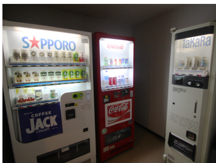
館内の自動販売機コーナー