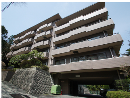
ファミリーヴィラ参番館外観