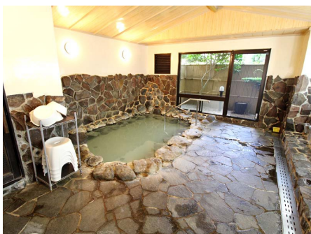
温泉大浴場（和風呂）