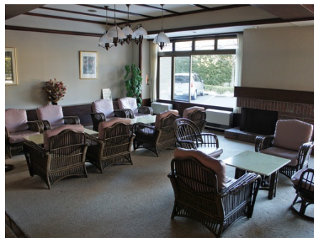
暖炉のあるロビー