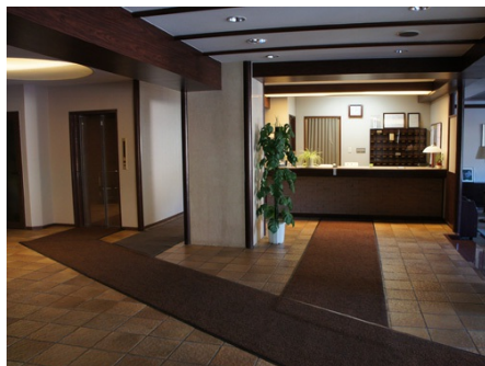
エントランスと管理室