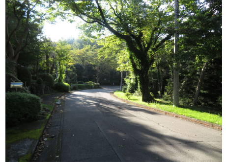
整備された別荘地内